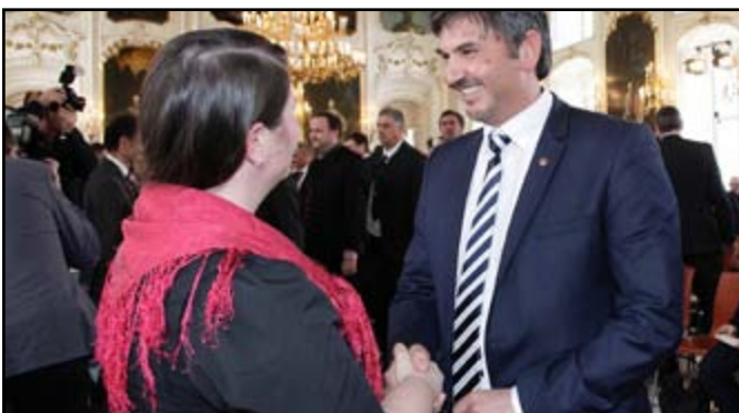
Angelobung durch Bezirkshauptfrau Olga Reisner in Innsbruck

Mein vorrangiges Ziel ist es, auch in dieser Gemeinderatsperiode, mich bestmöglich für die Anliegen aller Gemeindebürgerinnen und -bürger sowie Institutionen und Vereine einzusetzen. Ich hoffe bzw. bin überzeugt, dass nach diesem kurzen jedoch zum Teil auch emotional geführten Wahlkampf eine gedeihliche Zusammenarbeit aller gewählten Mandatäre möglich ist. Von Seiten meiner Gemeinderatsfraktion werden wir bestrebt sein, in der laufenden Periode eine gute und friedliche Zusammenarbeit zu forcieren, auch wenn es naturgemäß da und dort unterschiedliche Meinungen geben wird. Ein vernünftiges Miteinander im Gemeinderat entspricht aber zweifellos dem Willen der Bevölkerung und dem werden wir jedenfalls Rechnung tragen.